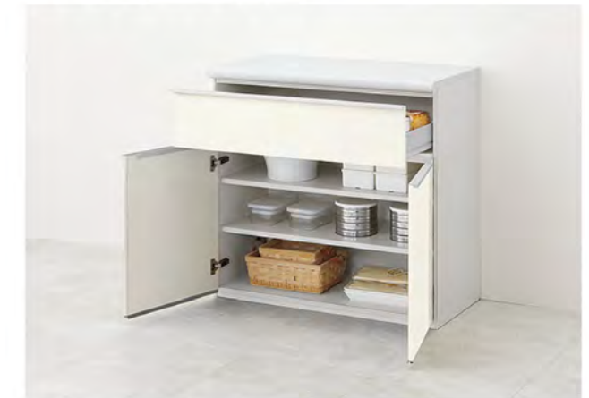
奥行45cm系 カウンター高さ85cm用